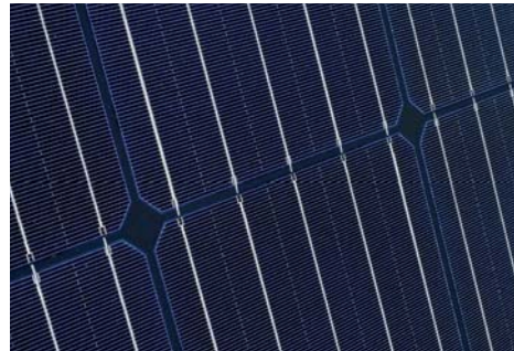
Vitovolt 300 im Detail

Die Photovoltaik-Module sind für den Einsatz auf Ein- und Mehrfamilienhäusern sowie Gewerbe- und Industriedächern geeignet.